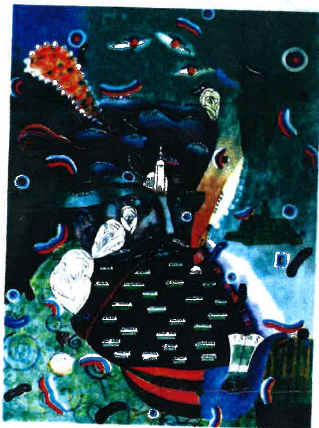
JURO TURZO, ZAKLADATEL TURZOVKY 2017; 75x100