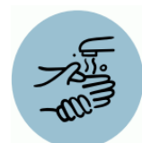
Dôsledná hygiena rúk

šíreniu prispievať aj kontaminované povrchy - kontaktom sa škodlivý patogén preniesie z povrchu na ruky a následne si ho možno nevedomky zaniest' na sliznice (ústa, nos či oči), cez