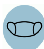
Prekrytie dýchacích ciest