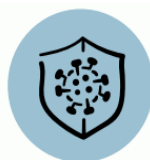
Očkovanie proti chrípke

Chrípka, chrípke podobné ochorenia a aj COVID-19 patria medzi nákazy prenášané vzdušnou cestou. V menšej miere môžu k ich