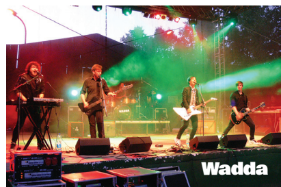
16. ročník Rock Beskyd Festu totiž uzatvorila kapela NIRVANA REVIVAL BAND.