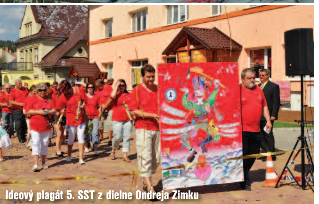
Ideový plagát 5. SST z dielne Ondreja Zimku

Hlavný program pozostával z vystúpení siedmych skvelých hudobných telies a výnimočná bola aj zostava v akej sa predviedli. Po prvý krát v histórii Beskydských slávností si návštevníci mesta mohli vychutnať folklórne súbory zo všetkých krajín tzv.V4. Predstavili sa folklórny súbor Csobolyó z Maďarska, FS Kęty z Poľska, SPT Javořina z Čiech a nechýbali ani stálice turzovských slávností – domáca Ludová hudba Gernátovci, Ženská folklórna skupina Turzovanka a FS Drevár.