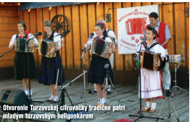
Otvorenie Turzovskej cifrovačky tradične patri mladým turzovským heligonkárom

Potom už pešiu zónu zasypal ohňostrojom trblietavých konfiat, ktoré mali tento odkaz spolu s vetrom odviať do ďalekých krajov, za každým jedným odcestovaným Turzovčanom.