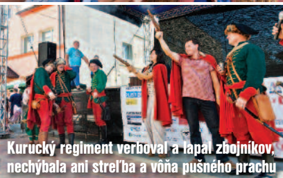
Kurucký regiment verboval a lapal zbojníkov, nechýbala ani strelba a vôňa pušného prachu

V hlavnom meste slovenských rekordov – v Turzovke sa počas záverečného víkendku Turzovského leta, tak ako je to zvykom, bojovalo o vytvorenie a zápis ďalšieho netradičného rekordu. Ten tohtoročný bol inšpirovaný známym zbojníkom a turzovským rodákom Tomášom Uhorčíkom (ten má od piatku, 16. augusta v Turzovke aj svoj pamätník) a jeho legendárnym pokladom zlatých dukátov ukrytým niekde v Beskydských lesoch. Cieľom 13. pokračovania turzovských rekordov bol Uhorčíkov poklad, tak ako káže zbojnícka česť – „nájsť a rozdať medzi ľudí“. Keďže poklad za uplynulých 300 rokov nikto nikde nenašiel, Turzovčania si ho ručne vyrazili a každému, kto prišiel, sa z neho ušla jedna minca – originálny dukát pre šťastie. Spolu to bolo symbolických 2013 mincí.