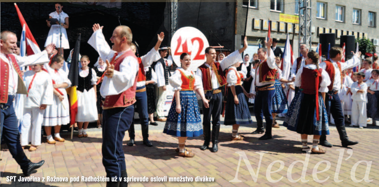
SPT Javořina z Rožnova pod Radhoštěm už v sprievode oslovil množstvo divákov