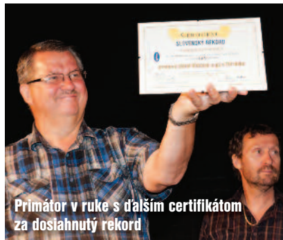
Primátor v ruke s ďalším certifikátom za dosiahnutý rekord