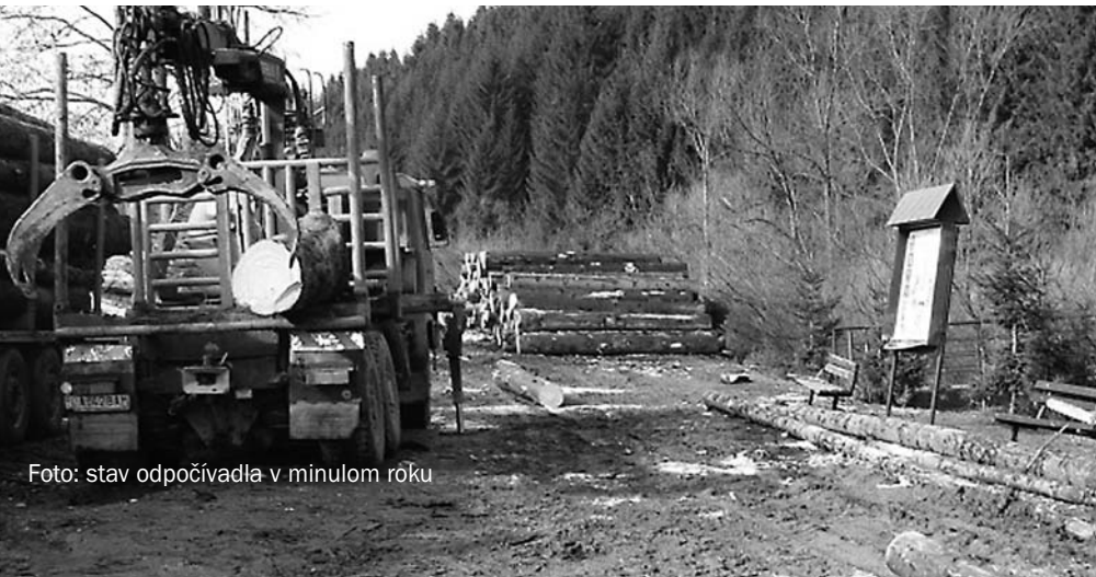
Foto: stav odpočívadla v minulom roku

pravidlám, nemá konca – kraja, preto sa samospráva rozhodla využiť moment ukončenia výstavby kanalizácie v úseku pod Živčakovou a začať s drobnými úpravami na pozemku, ktorý si od drobnovlastníkov prenajala. Možno si už viacerí okoloidúci všimli, že pri vstupe na pútnické miesto Živčaková stojí socha panny Márie, ktorá bola vytvorená počas tohtoročného rezbárskeho