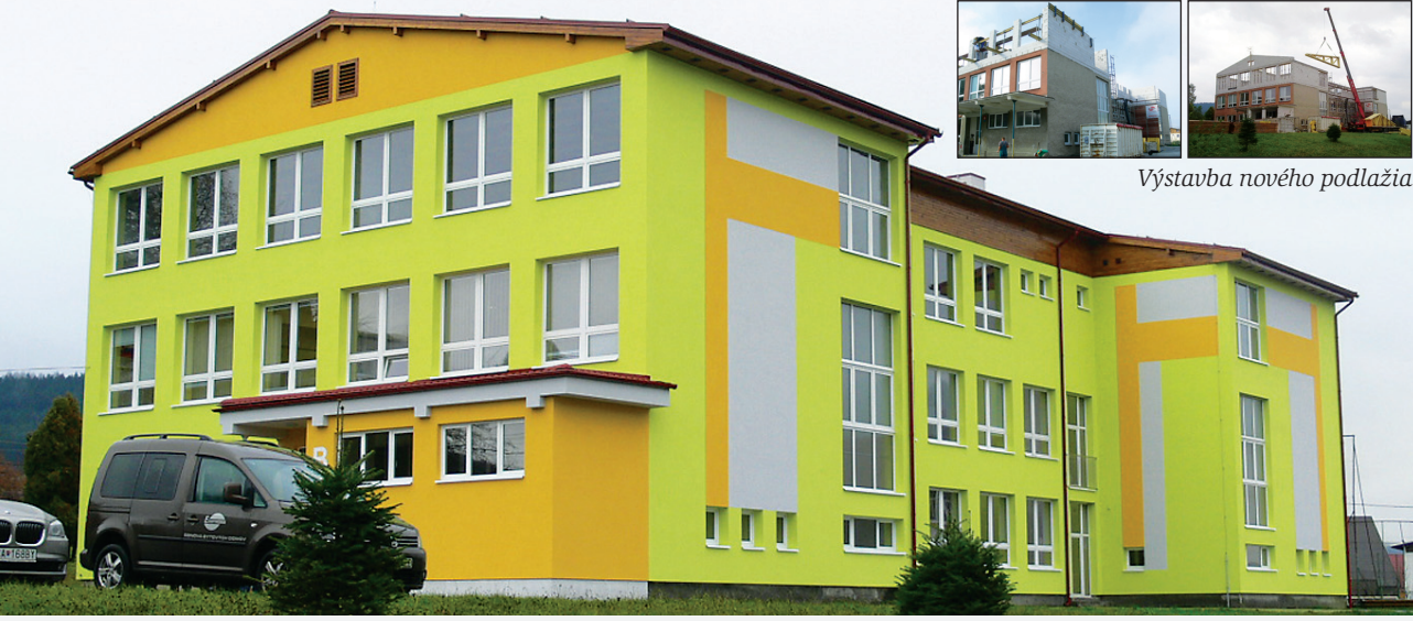
Výstavba nového podlažia

V prvom rade bude našou úlohou udržať vyvážený chod mesta, budeme sa snažiť o dokončenie takých projektov, ktoré do budúceho roka prechádzajú z predchádzajúcich období, napr. projekt cezhraničnej spolupráce v informačnom systéme, či realizácia časti verejného osvetlenia v meste. Sme pripravení začať nové investičné akcie, ktoré by sme chceli financovať s pomocou európskych peňazí nového programového obdobia 2014 - 2020. Tak ako v minulých rokoch, nechceme poľaviť ani na úseku kultúry a naďalej podporovať všetky kultúrno-spoločenské a športové aktivity počas celého roka 2014. Osvedčila sa nám práca mestskej polície, a práve preto bude našou snahou tento trend zachovať, prípadne ho ešte vylepšiť. Víziou pre budúci rok je aj pokračovanie a dokončenie II. etapy rekonštrukcie pavilónu „B“ na základnej škole a samozrejme chceme sa zamerať aj na opravu a rekonštrukciu ciest, či už to budú jestvujúce cesty, alebo príprava pozemkov pod budúce komunikácie v lokalite Bukovina, kde sme len predbežným schválili územný plán zóny. Pripravovaných aktivít je naozaj veľmi veľa, nie je možné ich vymenovať, preto chceme dať do pozornosti našim občanom, že návrh rozpočtu a po schválení aj samotný rozpočet je prístupný každému, a tí ktorí majú záujem sa s ním oboznámiť, ho nájdu na webovej stránke mesta Turzovka.