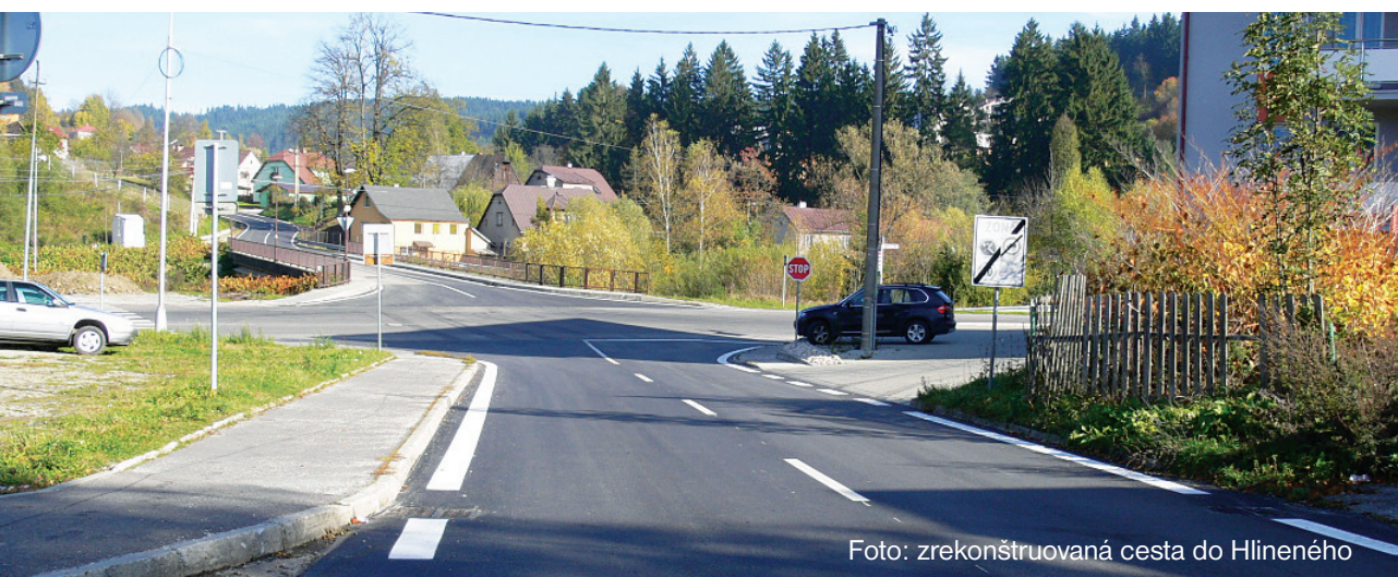
Foto: zrekonštruovaná cesta do Hlineného