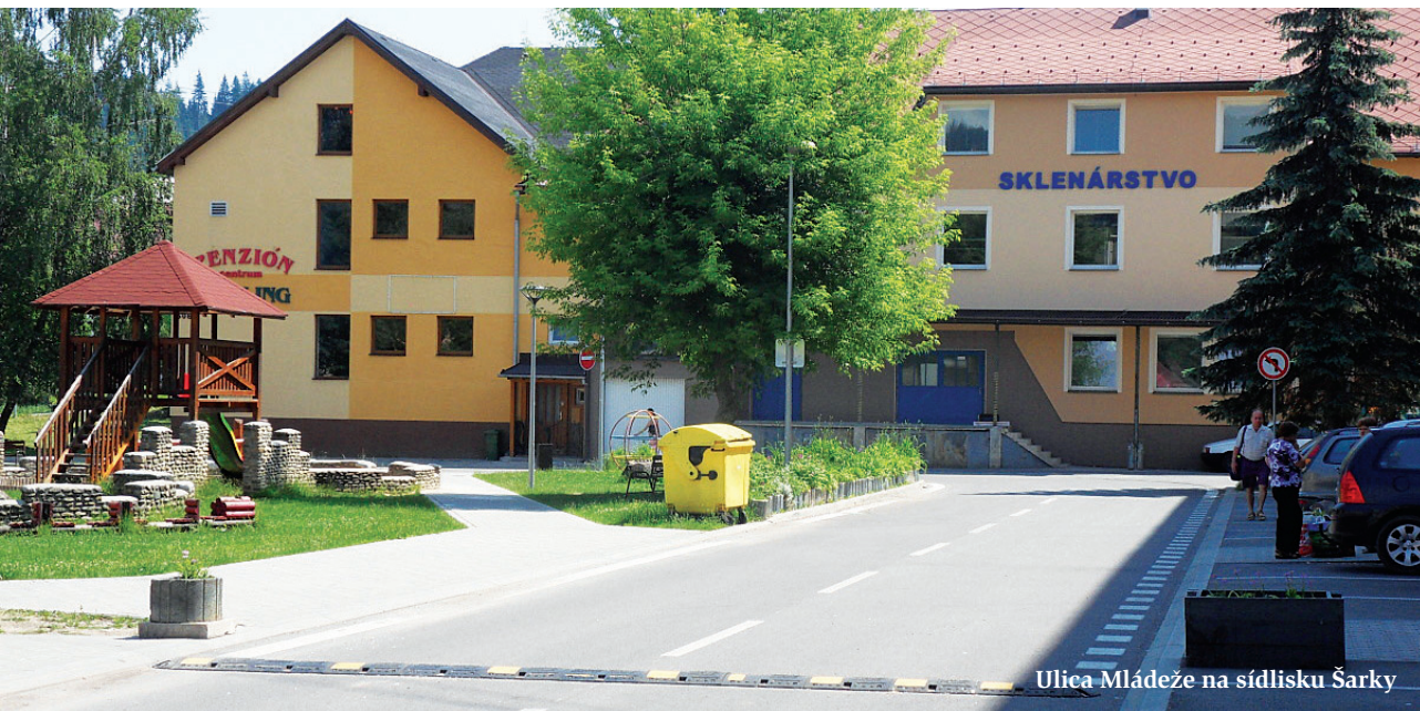
Ulica Mládeže na sídlisku Šarky