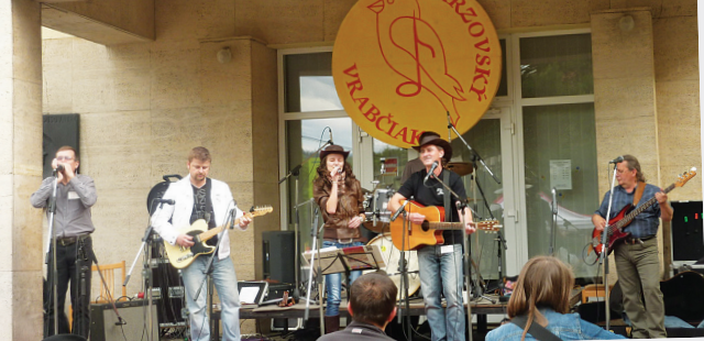
Country Limit Club – tohtoročný víťaz